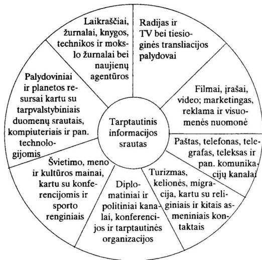
1 pav. Tarptautinių informacijos srautų kanalai ir tipai. Technologinė ir humanistinė orientacijos turi būti pristatomos kaip papildančios, susijusios ir adaptyvios [3]

Ryšiai su visuomene (PR) yra valdymo funkcija, padedanti sukurti ir palaikyti valstybės ir visuomenės abipusės komunikacijos, tarpusavio priėmimo bei bendradarbiavimo kanalus; nustatanti ir pabrėžianti valstybės įsipareigojimus visuomenei; palaikanti grįžtamąjį ryšį; padedanti jausti ir įvertinti permainas.