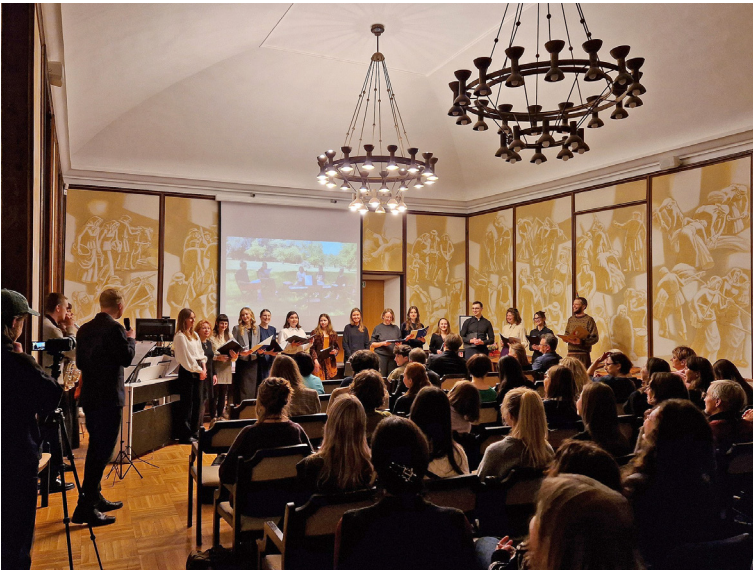
Semiotikų ansamblis „Kompetencija“.