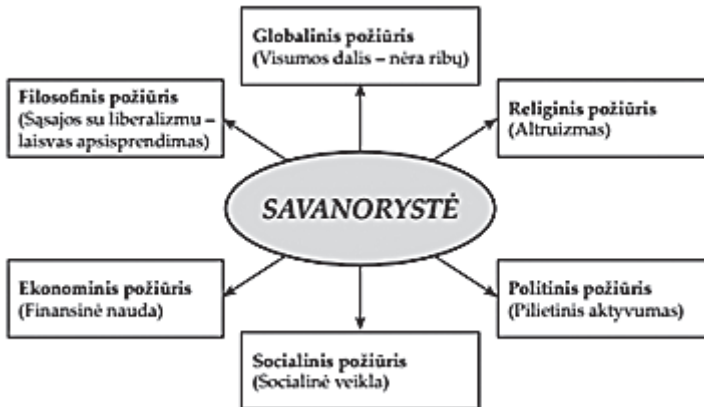
1 pav. Savanorystės fenomenas (Jezukevičiūtė, 2010)

Pasak D. Jezukevičiūtės (2010), savanorystė – tai fenomenas, reiškiny, į kurį galima žiūrėti skirtingai, aptarti globalizacijos, religijos, politikos, ekonomikos, filosofijos kontekste (žr. 1 pav.).