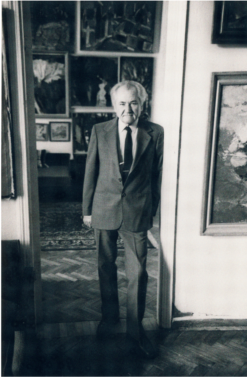
Profesorius namų meno galerijoje. Apie 1990 m.