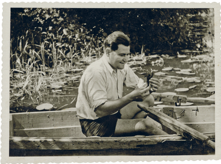
Išvykoje į Baškiriją sveikatos tikslu. Alkino sanatorija. 1953 m. VUB RS.