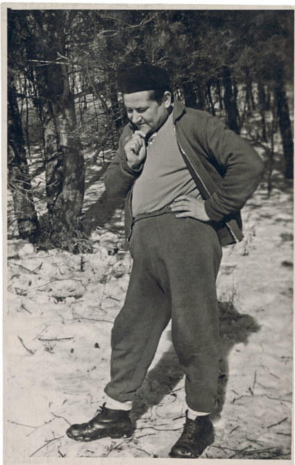
Profesorius slidžių žygyje. 1963 m. VUB RS.