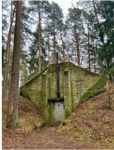
7 paveikslas. Lietuvių partizanų bunkeris.

būti, čia vokiečiai <...> “ 124 . Vis dėlto Kopūstėliuose veikiau sporadiškai priskiriami pavadinimai inscenizacijų metu ne tik susijungia į vientisą pasakojimą, bet ir keičia jo eigą, taip iliustruodami dinamišką bei pokyčiams atvirą asambliažo prigimtį: