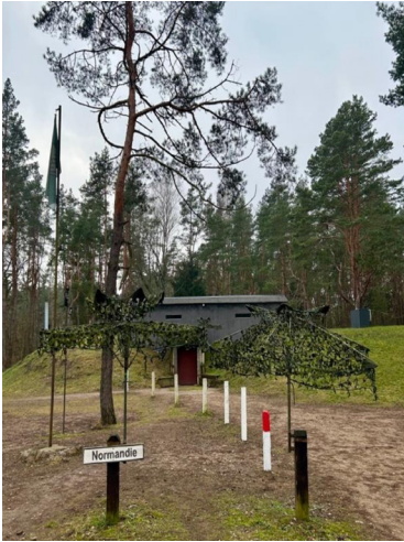
6 paveikslas. Bunkeris „Normandija“.