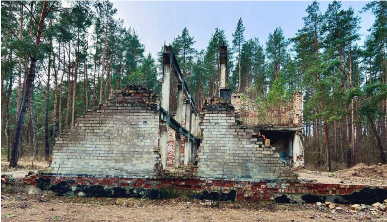
2 paveikslas. Apgrautas karinės paskirties objektas Kopūstėliuose.

Apleista visiškai. O darę visi, kas ką norėjo, kam ko reikėjo, tas ten, žinai... Uždergta, užplūta, išdraskyta, išniokota, paskui netgi ir pastatus pradėjo plytom ardyti, žodžiu, išvežinėti, tai va, iki tokio lygio. 82