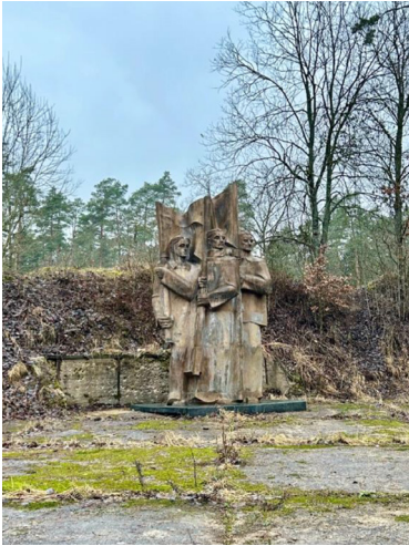
8 paveikslas. „Trys vėliavnešiai“ Kopūstėlių „Grūto parke“.