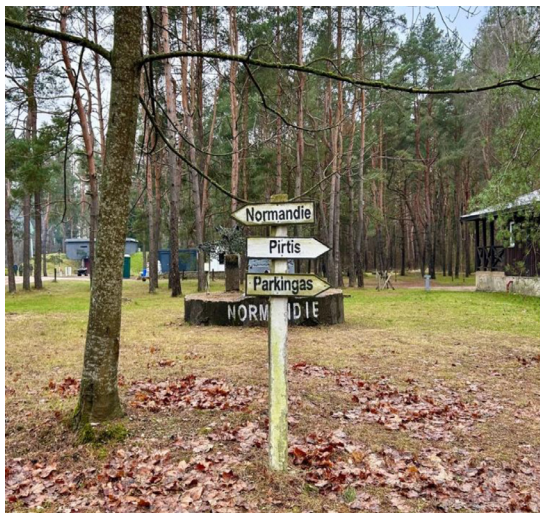
12 paveikslas. Kopūstėliai – „pramogų parkas“?

lis teritorijos tuo metu išnuomota šonaslydžio ( drifto ) treniruotėms. Vėliau bandyta grįžti prie ankstesnės veiklos, tačiau pastangos nebuvo sėkmingos – dalyvių dėmesys vis nukrypdavo į šalia esančius automobilių garažus, kur telkėsi Kopūstėlių svečiai ir pramogautojai.