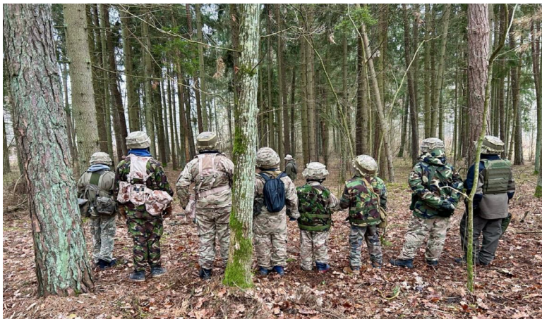
5 paveikslas. Būrelio „Miško broliai. Istorijos patyrimas“ akimirkos. Autorės nuotrauka (fotografuota su dalyvių ir „Miško brolių“ leidimu bei žinia).