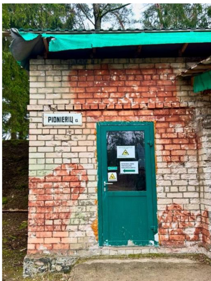
10 paveikslas. Pionierių gatvės ženklas Kopūstėlių „Grūto parke“.

rimo motyvus. Nors klubo veiklos pradžioje pateikėjai sovietinės bazės praeities nelaiškė reikšmingu veiksniu, jų pasakojimuose paabrėžiama, kad (per)kuriant Kopūstėliuose plėtojamą atminties tekstą šios praeities ignoruoti neįmanoma: „Sovietinė bazė, jina i niekad os nebus, kad nesovietinė, nu tai istorijos dalis, <...> kai buvom Sovietų Sąjungoj, negali iš istorijos išbraukt, kad mes nebuvom. Tai čia lygiai taip pat.“ 129