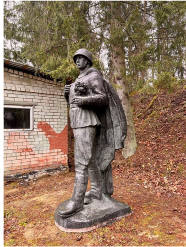
9 paveikslas. Paminklas sovietų kariui Kopūstėlių „Grūto parke“.

zistencijos metu priklausė Ukmergės kraštas, pavadinimu pažymėtas bunkeris (7 pav.). Sovietinę teritorijos dalį atspindi „Pionierių gatvė“ ir „rusų kampelis“, klubo narių dar vadinamas „Grūto parku“ – tokį pavadinimą ši vieta įgavo, nes čia pagal susitarimą su rajono savivaldybe stovi iš Ukmergės miesto nukelti „Vėliavnešių“ ir sovietinio kario paminklai 127 (8, 9 ir 10 pav.).